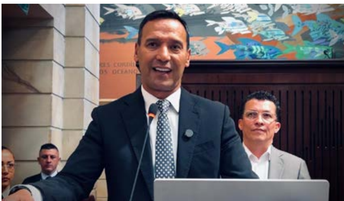
El ministro Sánchez Suárez enfatizó que las tropas tienen la orden perentoria de reprimir con contundencia cualquier manifestación delictiva y proteger a la población civil. Asimismo, desmintió restricciones operativas exponiendo como defensa las cifras oficiales de incautación de estupefacientes y neutralización de cabecillas.

Sánchez Suárez enfatizó que la orden presidencial es perentoria: ni la Presidencia de la República ni el Ministerio de Defensa