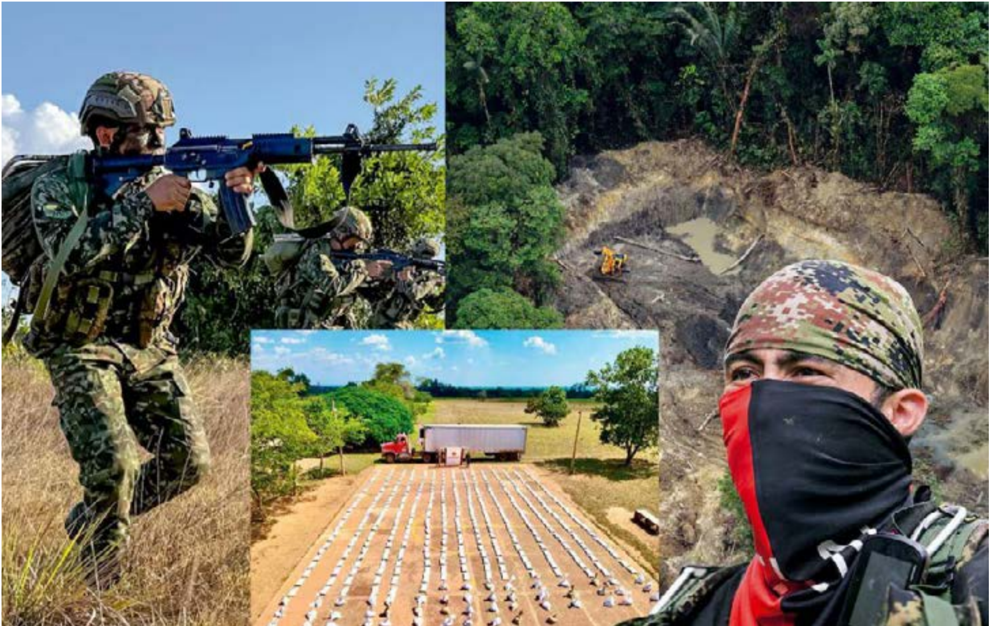
Decomisos frecuente de Coltán realizan las Fuerzas Militares en operativos contra el ELN

niobio y el tantalio, elementos con propiedades únicas e insustituibles en la fabricación de una amplia gama de dispositivos y tecnologías: Componentes cruciales para el funcionamiento eficiente de teléfonos móviles, computadoras portátiles, tabletas, cámaras digitales, consolas de videojuegos y sistemas GPS. El cerebro de la electrónica moderna, esenciales para el procesamiento