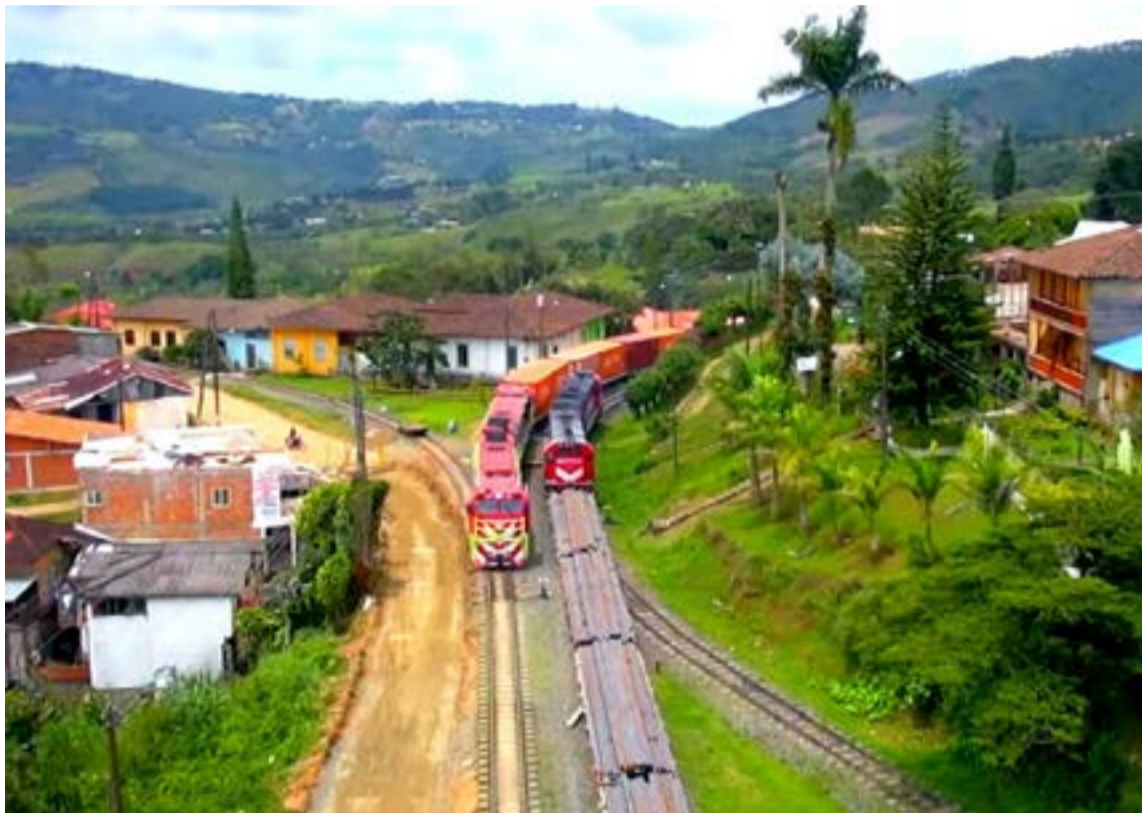
El tren en La Tebaida.

Antes de aparecer el «caballo de hierro», la producción industrial, minera y agropecuaria estaba limitada por la capacidad de los sistemas de transporte. El bienestar de la población, re-