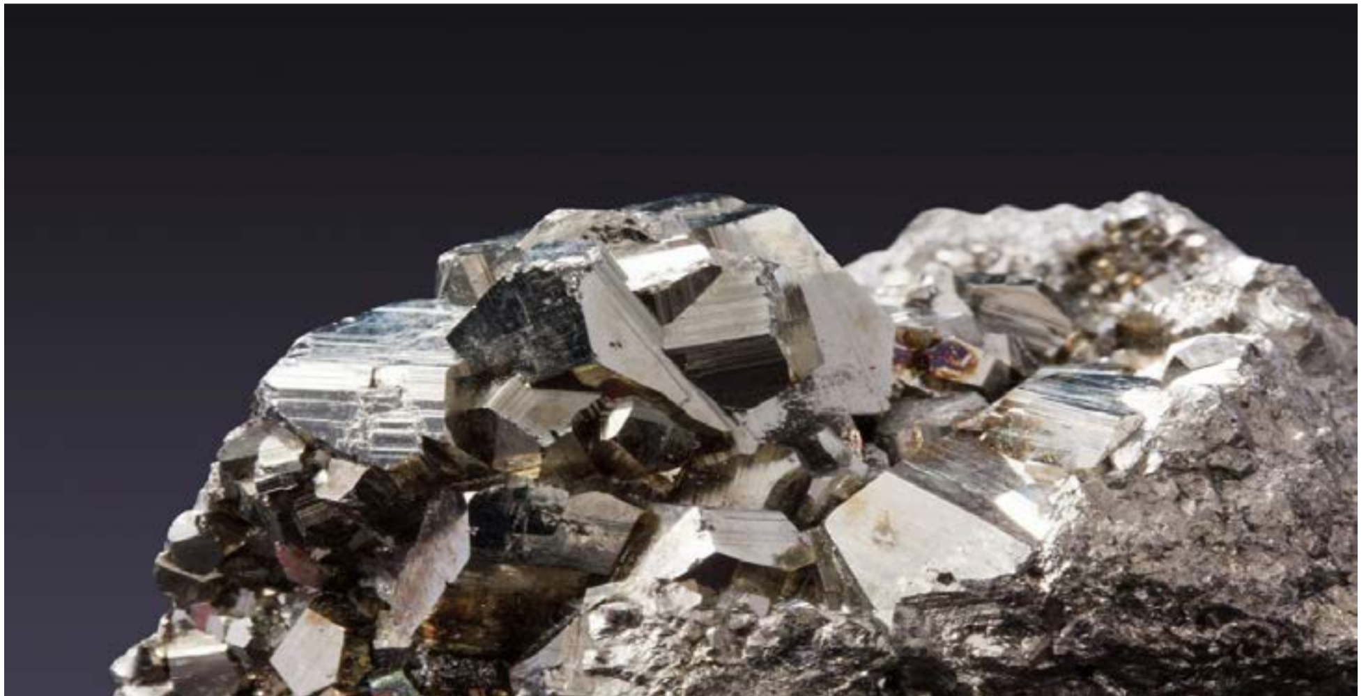
Coltán, mineral de gran importancia en el sector tecnológico

Un informe exhaustivo revela la ubicación, los actores detrás de la extracción ilícita, las rutas de comercio clandestino y el potencial futuro de un mineral estratégico que alimenta la industria tecnológica global.