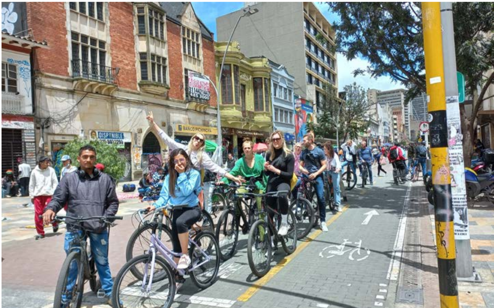
Turistas anglosajones y su respectivo guía se desplazan en bicicleta por el centro de Bogotá.

Víctor Hugo Lucero Montenegro Primicia Diario