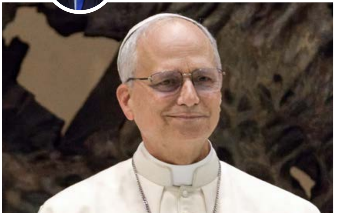
Papa León XIV

ricos para iluminar los desafíos de la revolución digital: