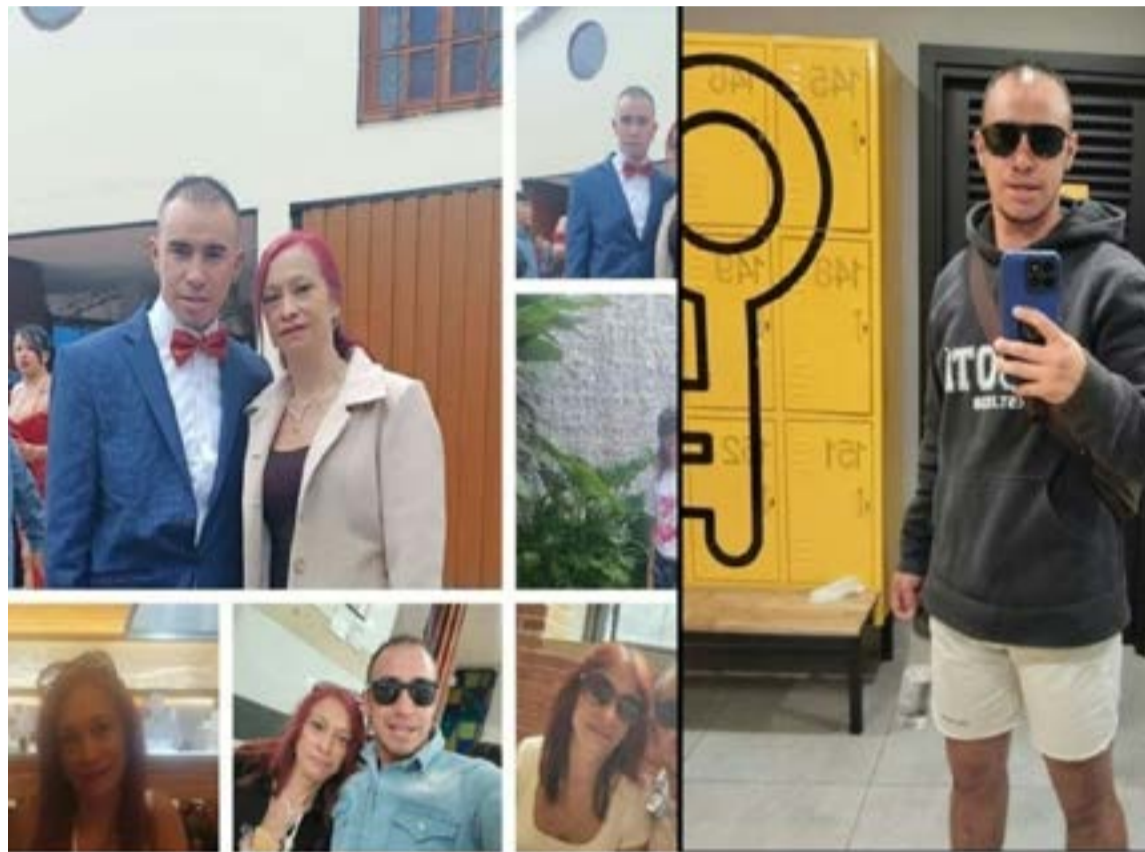
Los análisis forenses confirmaron que el deceso se produjo por asfixia mecánica y traumas contundentes, descartando una muerte natural o accidental. Con el fin de eludir la justicia, los victimarios ocultaron el cadáver en bolsas y cobijas antes de abandonarlo en una zona boscosa.

Los análisis forenses preliminares practicados al cadáver evidenciaron claras señales de asfixia mecánica y múltiples traumas provocados con objeto contundente. Estos hallazgos descartan