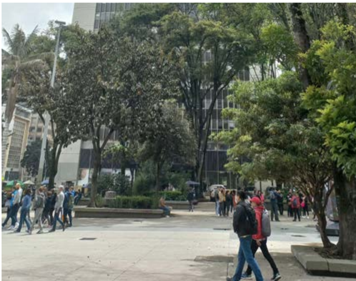
Simultáneamente son muchos los grupos de turistas del mundo que visitan, parque, museos, calles históricas, restaurantes bares entre otros sitios donde reina el idioma global del inglés.

Mientras los empresarios y dueños de establecimientos comerciales promueven activamente el uso del inglés, el sector público muestra rezagos preocupantes. La ausencia de una estrategia gubernamental clara, eficiente y de largo plazo para la enseñanza de esta lengua ha provocado situaciones incómodas a nivel diplomático, evidenciadas en representantes oficiales de Colombia en el extranjero que no dominan el idioma del país anfitrión.